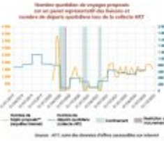
AOT - 06/2022 - Marché du transport par autocar librement organisé © 2022

La fréquentation se situe dans la continuité de celle observée au 2 ème semestre 2021, en ayant toutefois tendance à 30 % par rapport à 2019. Le nombre de passagers voyageant sur les liaisons domestiques est resté à 1,5 million au 1 er trimestre et approche 2 millions au 2 ème trimestre. En ce début d'année 2022, la situation de la demande reflète les caractéristiques d'après-crise, tant sur la part de la fréquentation des liaisons en concurrence que sur la répartition de la demande entre les liaisons nationales et à l'étranger.